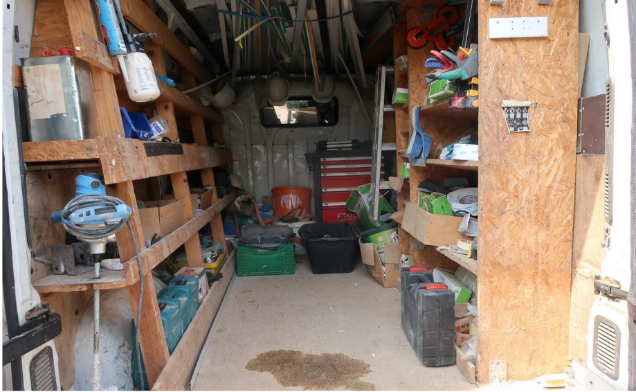
E-Handwerkzeug u. Werkzeugwagen